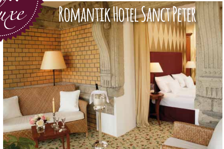
ROMANTIK HOTEL SANCT PETER