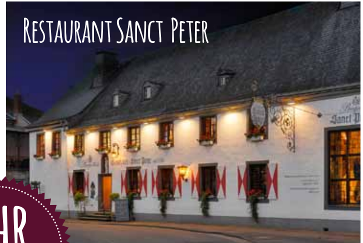
RESTAURANT SANCT PETER

Sie logieren im stilvollen Ambiente des Romantik Hotels Sanct Peter und erkunden mit uns die schönsten Plätze und Lokalitäten entlang des beliebten Rotweinwanderwegs.