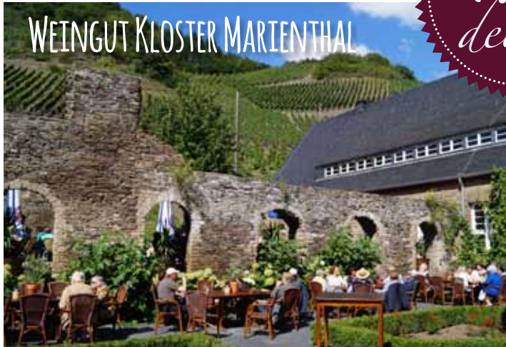
WEINGUT KLOSTER MARIENTHAL